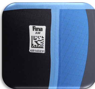
Couture soudée ou collée